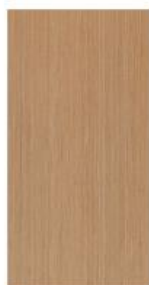
dąb classic 31-0084