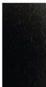
dąb forto czarny 31-0006-1