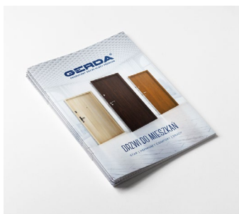
Katalog drzwi do mieszkań