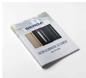
Katalog drzwi aluminiowych