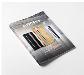
Katalog drzwi do domów