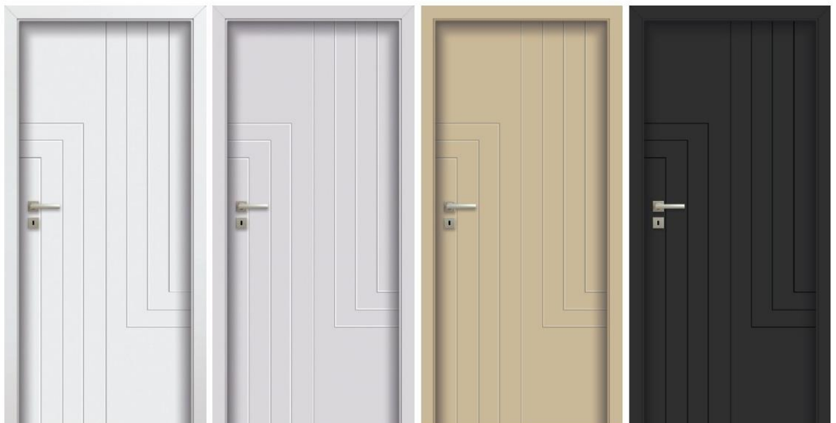
W00 biały RAL 9003

z charakterystycznym modnym frezowaniem: